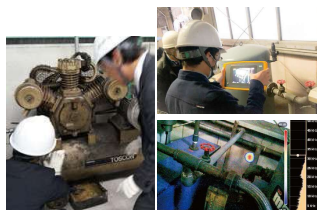
▲ 使用設備やエア漏れ等をチェック